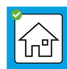
bei positivem Test Isolation, bei Kontakt Quarantäne